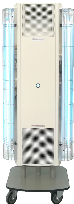
Modello su ruote 2BD-ST-Rc2

La serie UV-FAN comprende una vasta gamma di purificatori da parete o su ruote (modello -ST), diversi in base alle potenze UV-C della lampade e alle dimensioni.